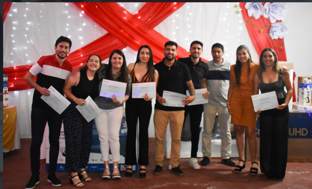
Entrega de certificados de fin de año de inglés.

particulares que deberán cumplir los postulantes en cada concurso y modalidad de beca ofrecida.