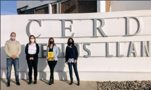
Incorporación de jóvenes recién recibidos.