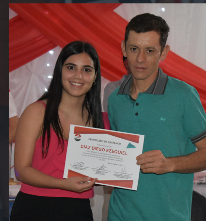
Entrega de certificados de fin de año de curso de excel. (Chepes)